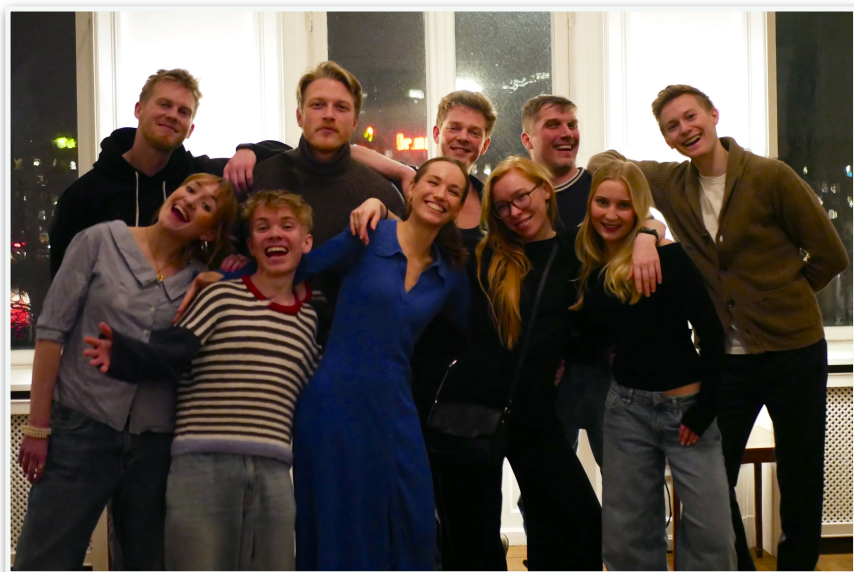
Professionelle og frivillige sammen til vores første møde.

Ud over de seks professionelle skuespillere, består resten af ensemblet af frivillige.